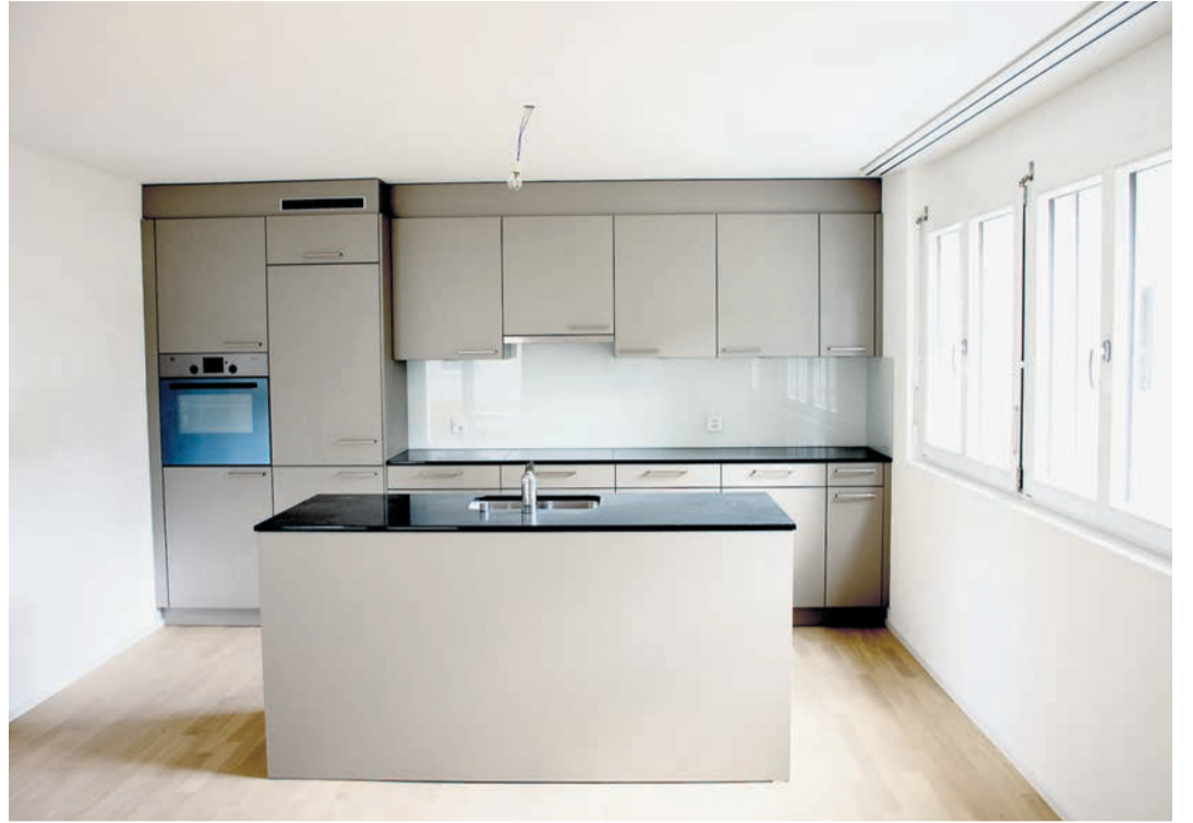
In den modernen und top ausgerüsteten Küchen ist alles vorhanden, was benötigt wird.