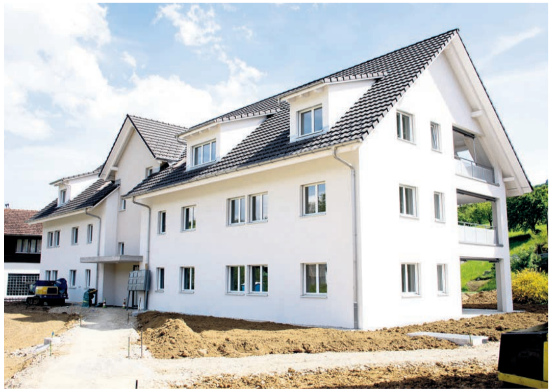
Das erste von zwei Mehrfamilienhäusern der Überbauung im Glück von der Hauptstrasse aus gesehen.

Toller Auftrag, sympathische Zusammenarbeit. Danke herzlich!