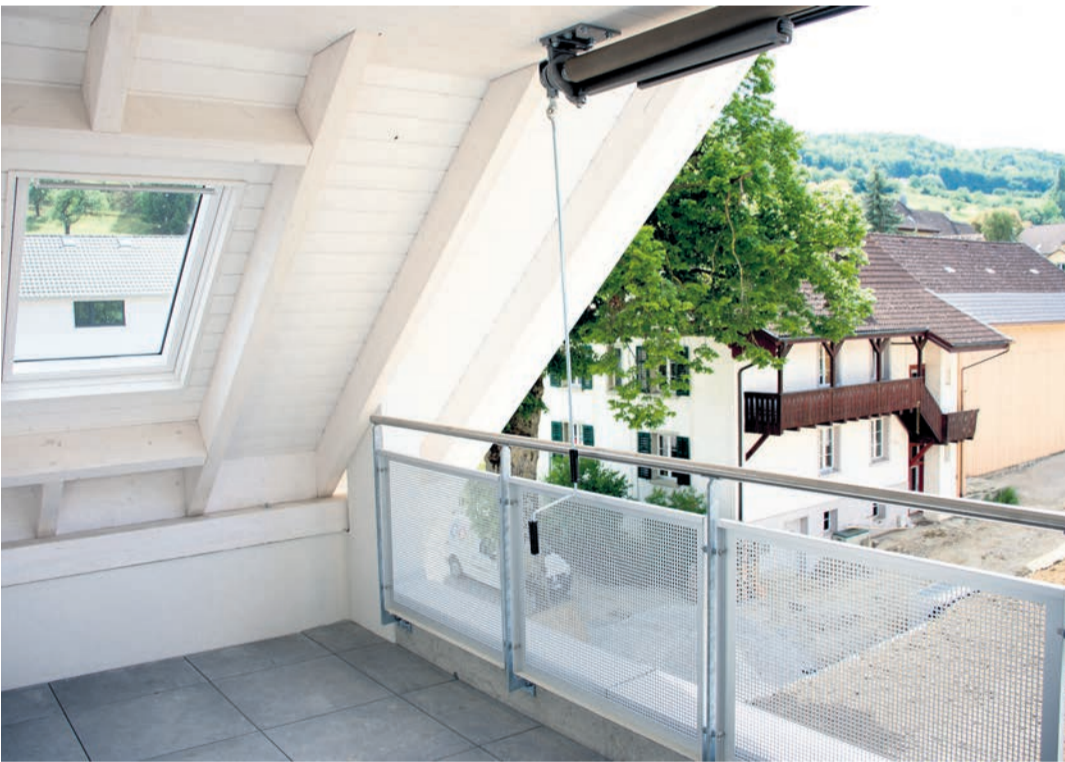
Eine private Oase der Ruhe und des Geniessens ist auf der Terrasse mit Ausblick zu finden.