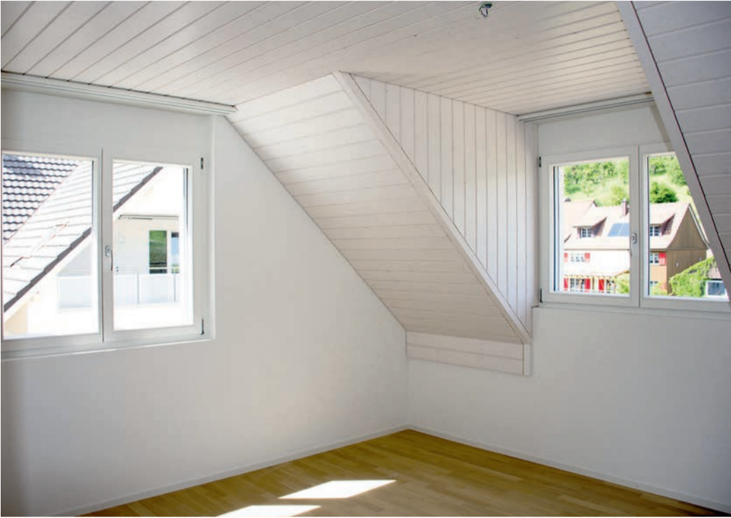
Grosszügig konzipierte und helle Räumlichkeiten sorgen für ein angenehmes, behagliches Wohnen.